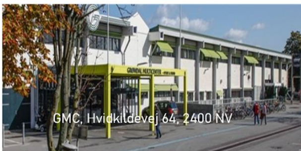
GMC, Hvidkildevej 64, 2400 NV

Men bortset fra varmtvands-gymnastik og udendørs bueskydning om sommeren, så er alt stadig samlet i GMC.