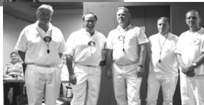
Efter en lidt særpræget opvarmning er dommerne klare til dagens dont.

kende for internationale topdommere. Samtidig har vi en del hjemlige divisionsdommere, som kommer igen år efter år. Så vi er godt kørende på dommerfronten.