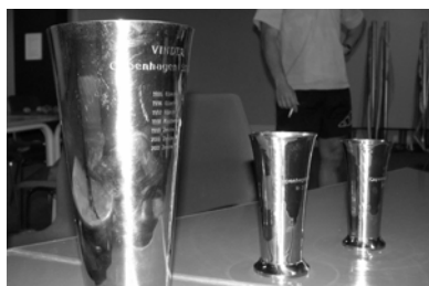
Der spilles om mere end om æren

kludere allerede nu – det blev en stor succes. Alle hold gav udtryk for, at terminen passede dem godt, bortset fra at der lige netop i år var VM 14 dage efter, så ingen af holdene mødte op med deres landsholdspillere. De var i træningslejr.